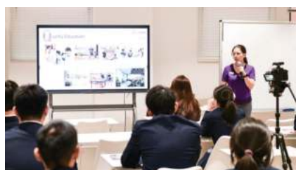
香港中文大学 (2025 QS排名#37)