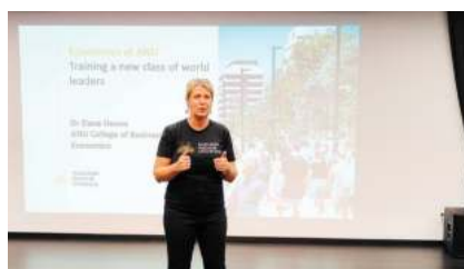
澳大利亚国立大学 (2025 QS排名#30)