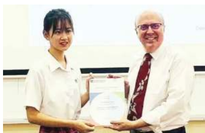
国际剑桥A-Level数学统考 全球最高分