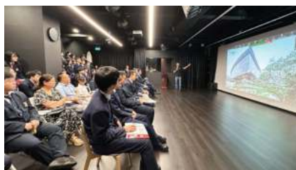
南洋理工大学 (2025 QS排名#15)