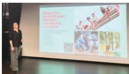
麦吉尔大学 (2025 QS#29)