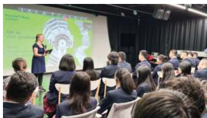
帝国理工学院 (2025 QS排名#2)