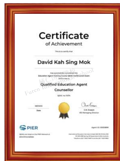
澳大利亚国际教育机构 国际认证教育代理顾问资质