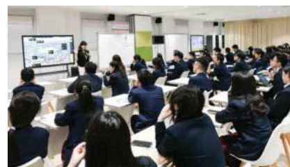
新南威尔士大学 (2025 QS排名#19)