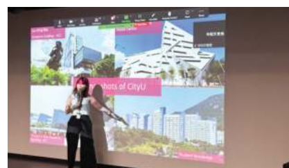
香港城市大学 (2025 QS排名#62)