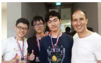
2017年亚洲学生领导力峰会金奖