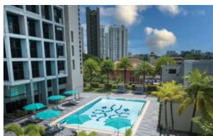
本校区诺富特公寓

辅仁校区诺富特公寓位于新加坡乌节中心地带，达尔维（男生）公寓位于新加坡黄金地段第10邮区的 Dalvey Road，哲沃思(女生)公寓则位于使馆区，靠近印尼、文莱、马来西亚大使馆的Jervois Road。