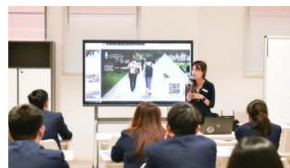
约翰·霍普金斯大学 (2025 QS排名#32)