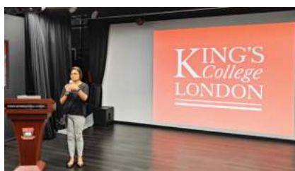
伦敦国王学院 (2025 QS排名#40)