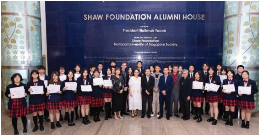
新加坡国立大学商学院合作项目

此外，学校还长期举办多种多样的国际学生领导力活动、社区义工活动及跨国公益活动等，并与各专业机构、俱乐部合作，积极拓展校园课外活动，丰富学生的课余生活，促进学生的个性化和多元化发展。