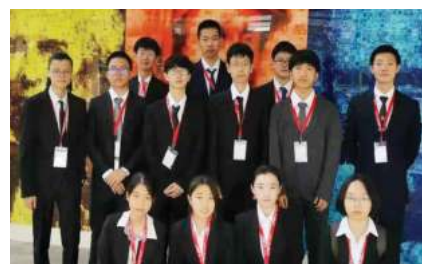
英国奥林匹克数理化学竞赛 金银铜牌20枚