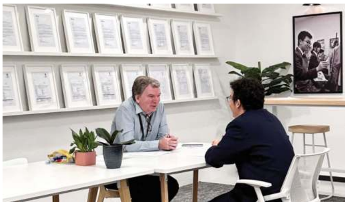
英语分级一对一口语考试