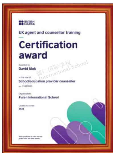
英国文化教育协会 国际认证大学招生和申请资质

辅仁具有英国文化教育协会和澳大利亚国际教育机构颁发的权威的国际认证资质，还拥有专业的校内升学规划指导团队 Guidance and Counselling Office，简称GCO，定期开设升学规划指导讲座，为学生量身定制升学规划方案，力求帮助每一位学生进入理想的专业和大学。