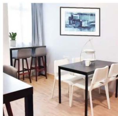
上图为达尔维(男生)公寓公共空间