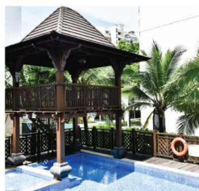
上图为哲沃思(女生)公寓游泳池