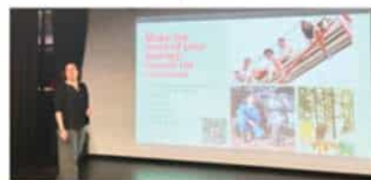
麦吉尔大学 (2025 QS#29)