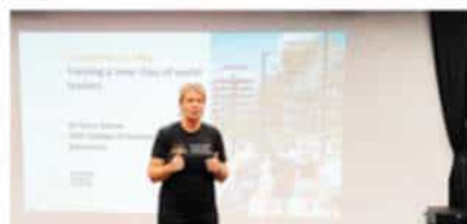
澳大利亚国立大学 (2025 QS排名#30)