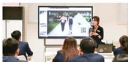
约翰·霍普金斯大学 (2025 QS排名#32)