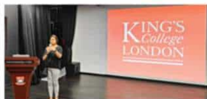
伦敦国王学院 (2025 QS排名#40)