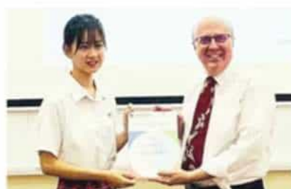
国际剑桥A-Level数学统考 全球最高分