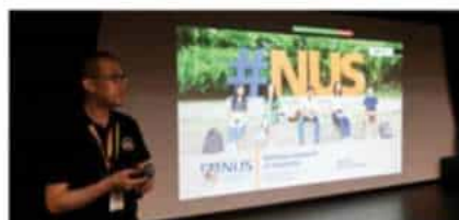
新加坡国立大学 (2025 QS排名#8)