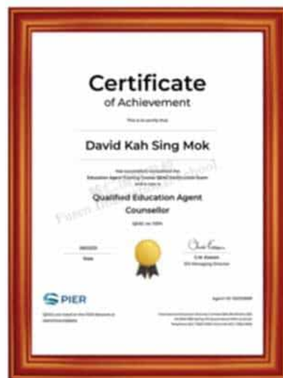
澳大利亚国际教育机构 国际认证教育代理顾问资质