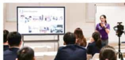
香港中文大学 (2025 QS排名#37)