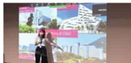
香港城市大学 (2025 QS排名#62)