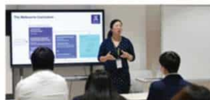
墨尔本大学 (2025 QS排名#13)