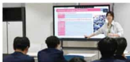
香港理工大学 (2025 QS排名#57)