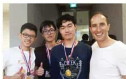
2017年亚洲学生领导力峰会金奖