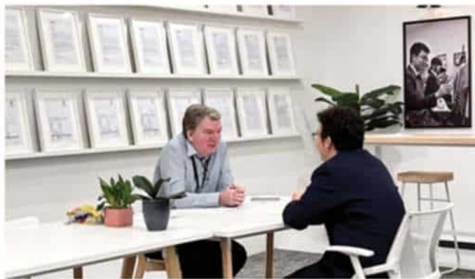
英语分级一对一口语考试