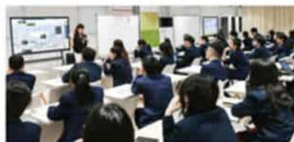
新南威尔士大学 (2025 QS排名#19)