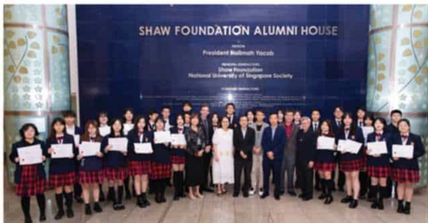
新加坡国立大学商学院合作项目

此外，学校还长期举办多种多样的国际学生领导力活动、社区义工活动及跨国公益活动等，并与各专业机构、俱乐部合作，积极拓展校园课外活动，丰富学生的课余生活，促进学生的个性化和多元化发展。