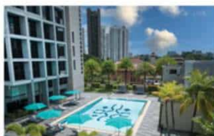
本校区诺富特公寓

辅仁校区诺富特公寓位于新加坡乌节中心地带，达尔维（男生）公寓位于新加坡黄金地段第10邮区的 Dalvey Road，哲沃思(女生)公寓则位于使馆区，靠近印尼、文莱、马来西亚大使馆的Jervois Road。