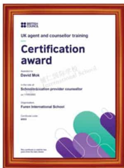
英国文化教育协会 国际认证大学招生和申请资质

辅仁具有英国文化教育协会和澳大利亚国际教育机构颁发的权威的国际认证资质，还拥有专业的校内升学规划指导团队 Guidance and Counselling Office，简称GCO，定期开设升学规划指导讲座，为学生量身定制升学规划方案，力求帮助每一位学生进入理想的专业和大学。