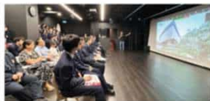
南洋理工大学 (2025 QS排名#15)