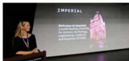
帝国理工学院 (2025 QS排名#2)