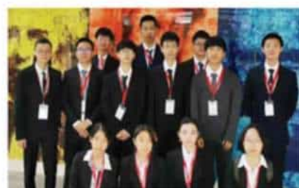
英国奥林匹克数理化学竞赛 金银铜牌20枚