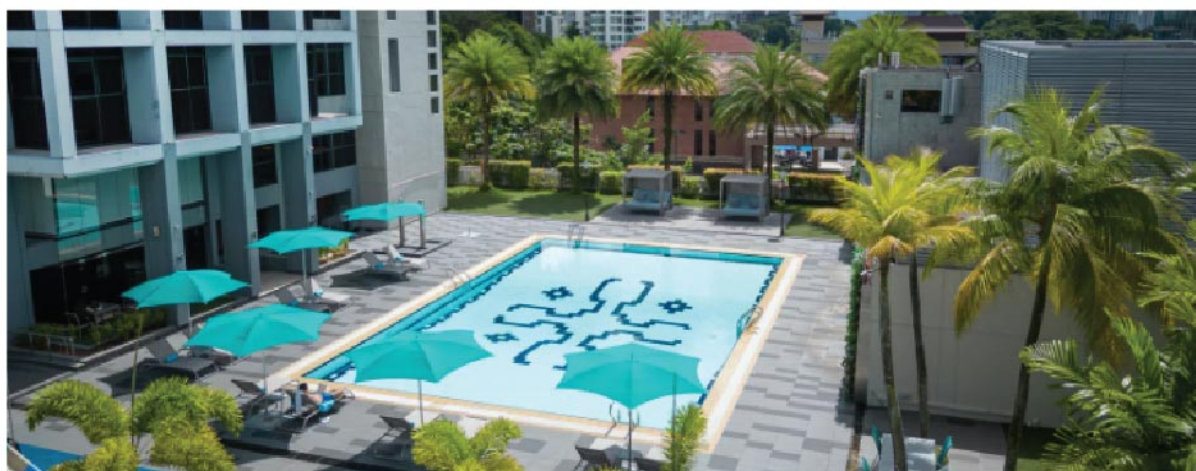
上图为辅仁校区诺富特公寓游泳池