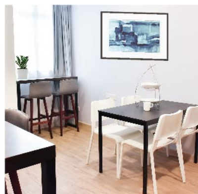
上图为达尔维(男生)公寓公共空间